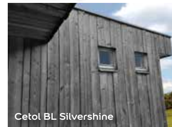
Cetol BL Silvershine